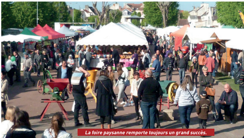
La foire paysanne remporte toujours un grand succès.

C'est désormais devenu une tradition que de s'y rendre pour y découvrir les métiers d'antan et y déguster les produits locaux. Le forgeron, le maréchal ferrant, le vannier, le potier, le bourrelier travailleront aux