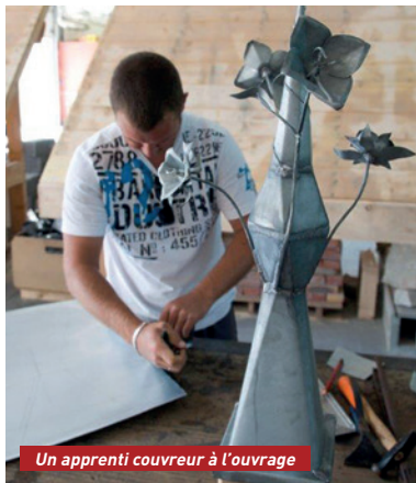
Un apprenti couvreur à l'ouvrage

vues de tous. Cette année, pour la 1 re fois depuis sa création, les Compagnons du Tour de France y seront présents. Installés dans le théâtre municipal, ils feront état de tout leur savoir-faire grâce à de nombreuses démonstrations sur les différents métiers du bâtiment.